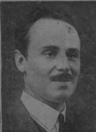
SIR OSWALD MOSLEY